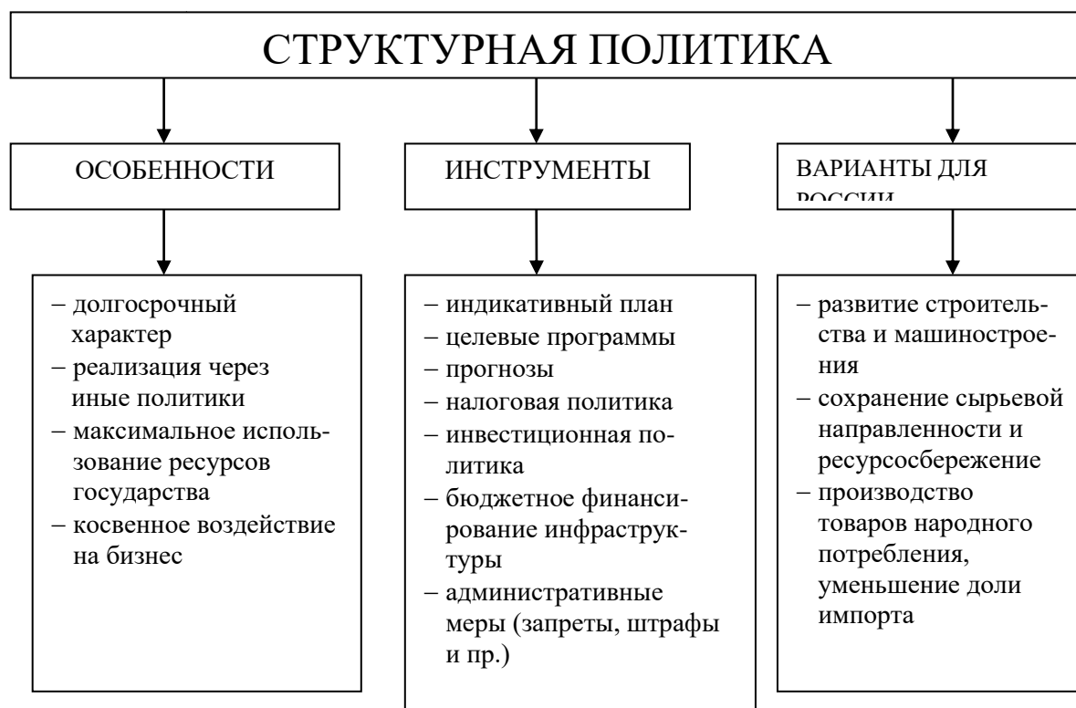
Рисунок 1 - Варианты изменения структуры российской экономики

На рисунке 1 показаны возможные варианты изменения структуры российской экономики. Покажите достоинства и недостатки предлагаемых вариантов развития, возможности для изменения структуры экономики.